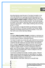
Reflexiones semanales sobre La Fundación Rotaria (descargar en: http://www.rotary.org/languages/spanish/newsroom/downloadcenter/index.html#erey )

Disponibles a través de http://shop.rotary.org :